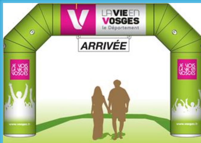
Modèle Petite Arche