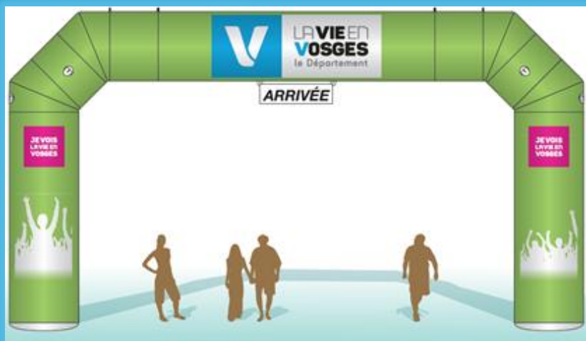
Modèle Grande Arche